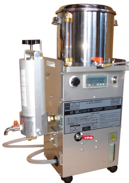
【粘度コントローラーに取付型】